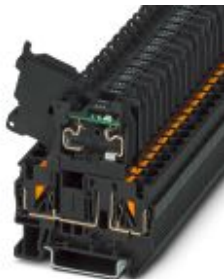
Borne para fusible con palanca, color negro, para cartuchos fusible G de 5 x 20 mm, con LED para 24 V AC/DC

Tenga en cuenta que los datos indicados aquí proceden del catálogo en línea. Los datos completos se encuentran en la documentación del usuario. Son válidas las condiciones generales de uso de las descargas por Internet. ( http://phoenixcontact.es/download )