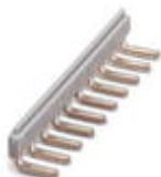
Peine puenteador, Puenteo en el punto de embornaje, paso: 8 mm, número de polos: 10, color: gris