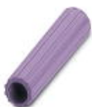
Casquillo aislante, color: violeta