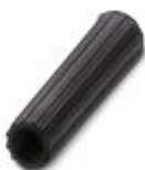
Casquillo aislante, color: negro