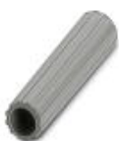
Casquillo aislante, color: gris