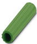
Casquillo aislante, color: verde