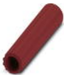
Casquillo aislante, color: rojo