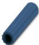
Casquillo aislante, color: azul