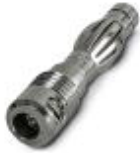
Clavija de pruebas, color: plata