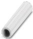
Casquillo aislante, color: blanco